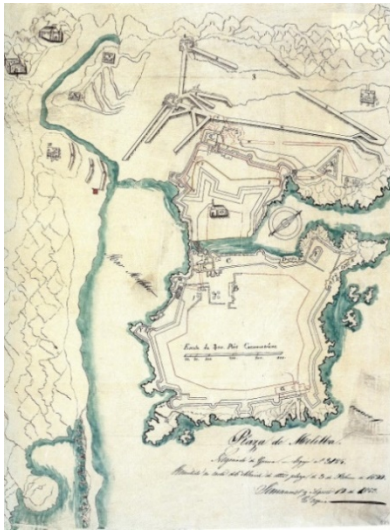
Plano de Melilla 1622.